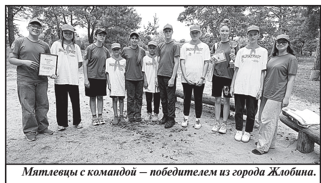
Мятлевцы с командой – победителем из города Жлобина.

чи проводили над детьми изуверские эксперименты и использовали маленьких узников для забора крови. Фашисты садистки обескровливали детей, а затем сжигали трупы. Не зря Красный берег называют «детской Хатынью». На территории Белоруссии в годы войны фашисты создали 16 концентрационных детских лагерей.