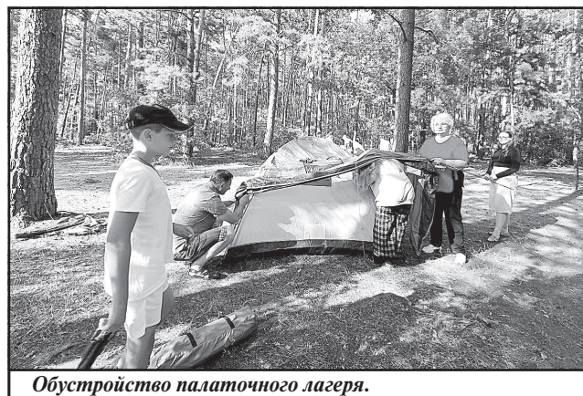
Обустройство палаточного лагеря.