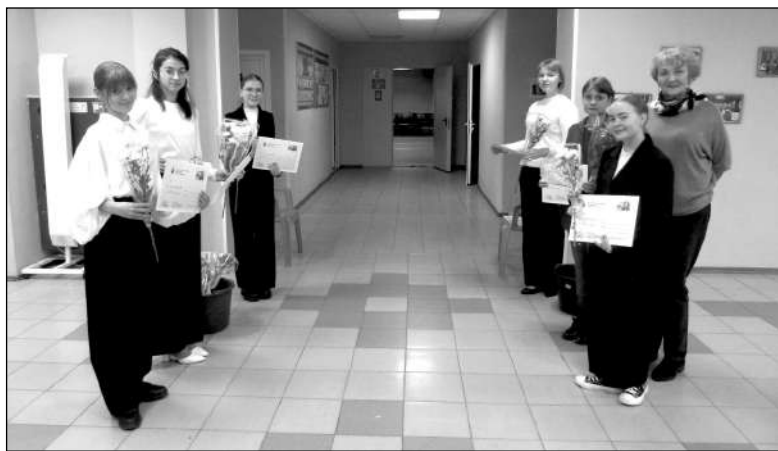
Всех участников мероприятия дети встречали с цветами и праздничными открытками.