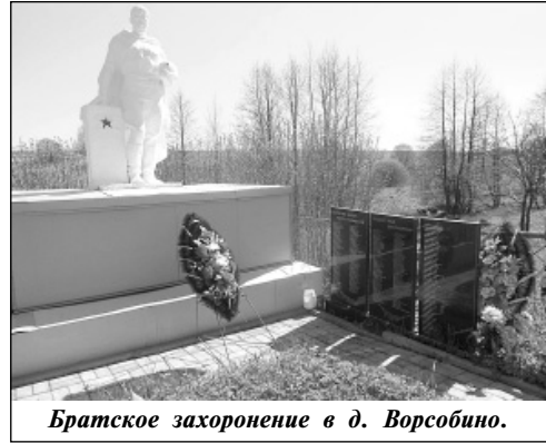
Братское захоронение в д. Ворсобино.

лось удачно. В Интернете было сказано, что в д. Ворсобино девять