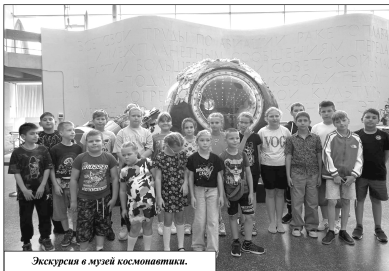
Экскурсия в музей космонавтики.

В канун дня начала Великой Отечественной войны было проведено мероприятие «Мы этой памяти верны. Начало войны». Ребята вместе с учителями и вожатыми посетили братскую могилу, поч-