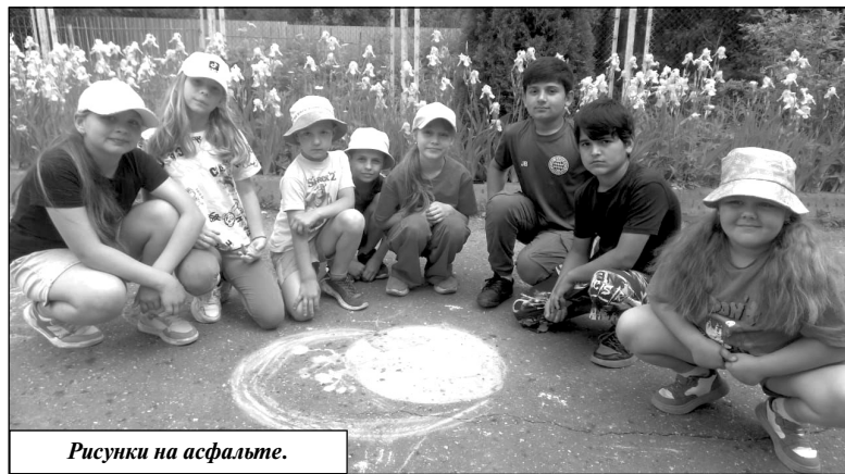
Рисунки на асфальте.

Каждый день ребята получали полноценное питание. Разнообразные и вкусные блюда для них