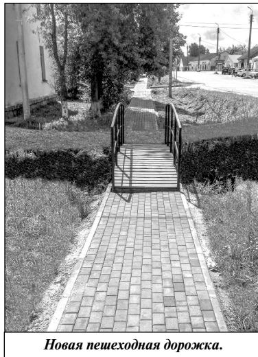
Новая пешеходная дорожка.

Согласно онлайн-голосованию для юных жителей поселка по данной программе была построена детская площадка для игр в индей-