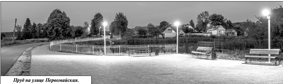
Пруд на улице Первомайская.

его благоустройство, а помогает в этом реализация федеральных, региональных и муниципальных программ.