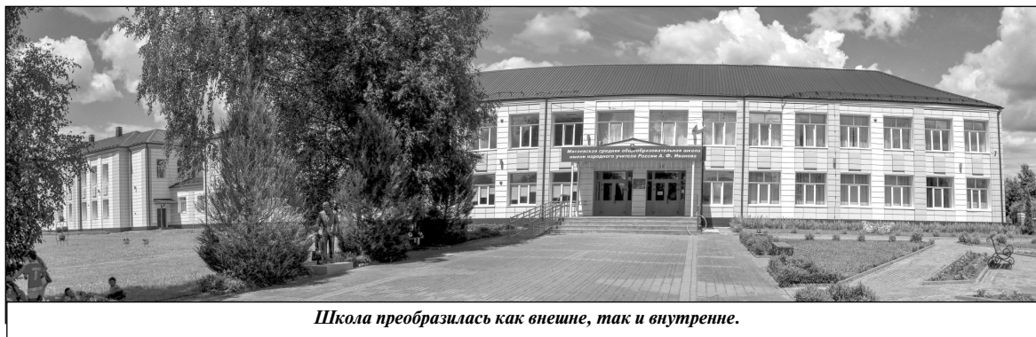
Школа преобразилась как внешне, так и внутренне.

Все представленные программы – это лишь часть того, что реализуется в поселке Мятлево. Только за минувший год по федеральному проекту «Чистая вода» в поселке Мятлево были построены и введены в эксплуатацию две