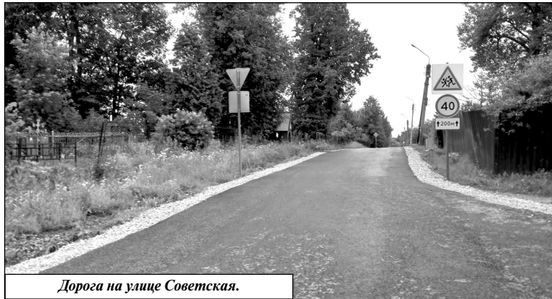
Дорога на улице Советская.

лей) социальных проблем местного уровня развивается механизм – инициативное бюджетирование. В Калужской области внедрение механизмов инициативного бюджетирования осуществляется, в частности, в рамках ведомственной целевой программы «Совершенствование системы управления общественными финансами Калужской области».