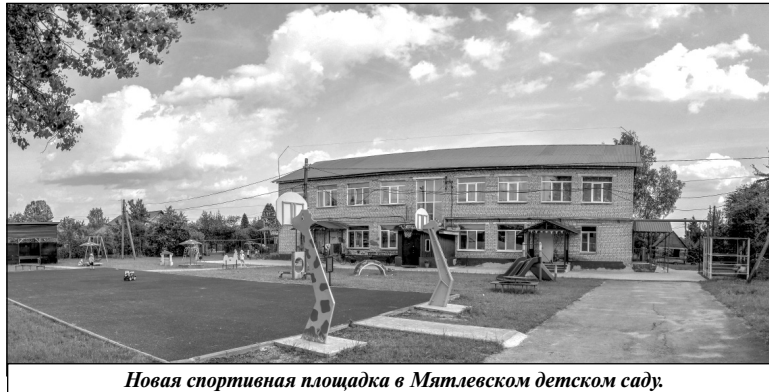
Новая спортивная площадка в Мятлевском детском саду.

лей) социальных проблем местного уровня развивается механизм – инициативное бюджетирование. В 2020 году был благоустроен родник на улице Первомайская, в течение последних трех лет произведен ремонт уличного освещения как в самом поселке Мятлево, так и в деревнях Айдарово, Пушкино, Кононово, Богданово, Гришино, Фотьяново, а также проведена обработка мест произрастания борщевика Со-