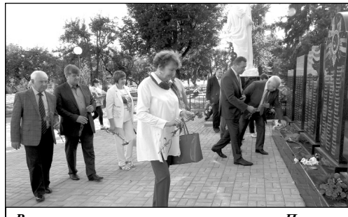
Возложение цветов к мемориалу в сквере Памяти.

Основные развлекательные мероприятия в этот день прошли на территории КСЦ «Олимп». Первым из них стал фестиваль красок Холи. Его организаторами выступили молодежный