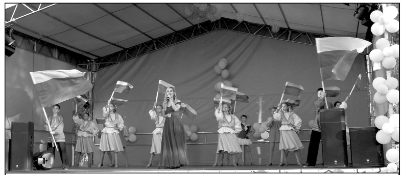
Финальный номер концертной программы, посвященной 36-ой годовщине со дня воссоздания Износковского района.