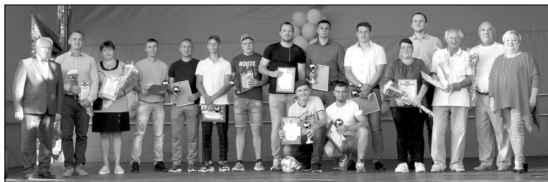
С праздником, Износковский район!