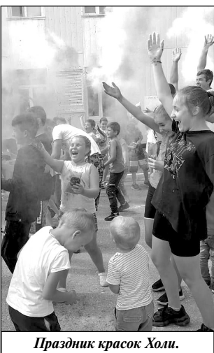
Праздник красок Холы.