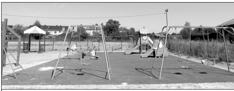
В Износках на детской игровой площадке на улице Мичурина сделано современное резиновое покрытие.

хорошая возможность участвовать в решении актуальных вопросов родного края.