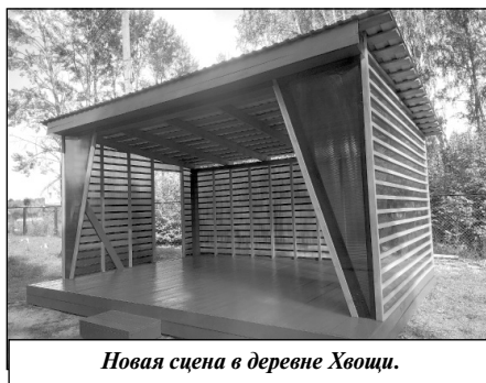
Новая сцена в деревне Хвощи.

Всего в этом году в регионе реализуется 240 проектов: на 77 объектах работы завершены, 109 находятся в стадии выполнения.