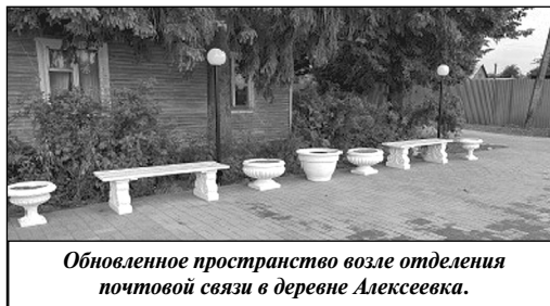
Обновленное пространство возле отделения почтовой связи в деревне Алексеевка.

порядок воинские мемориалы и захоронения, ремонтируются дороги, дома культуры и сельские библиотеки. В селах и деревнях области появляются новые скверы, парки и зоны отдыха.