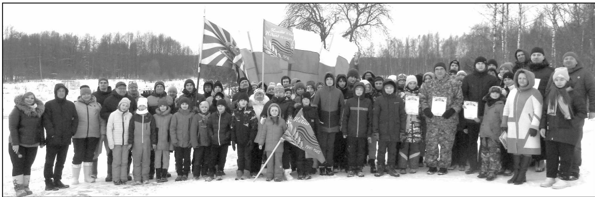
Участники кросса памяти.