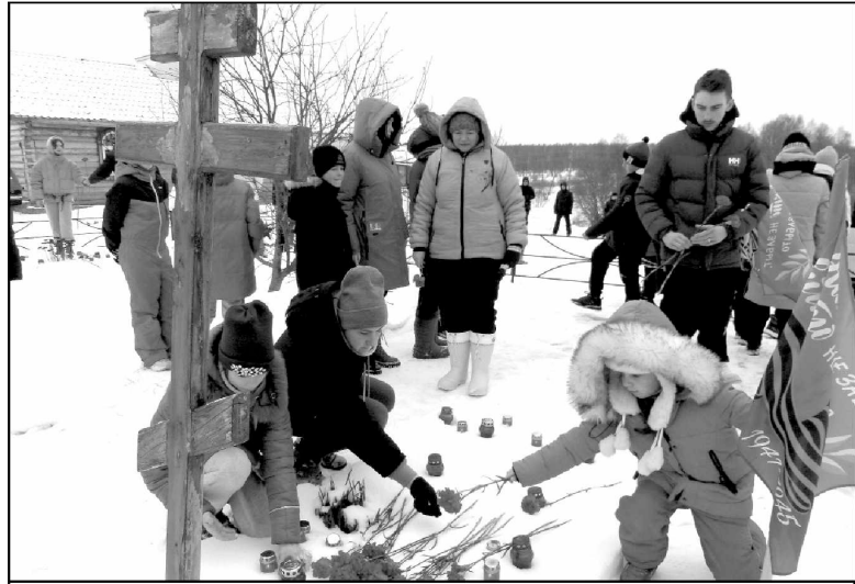
На белом снегу россыпь красных гвоздик...