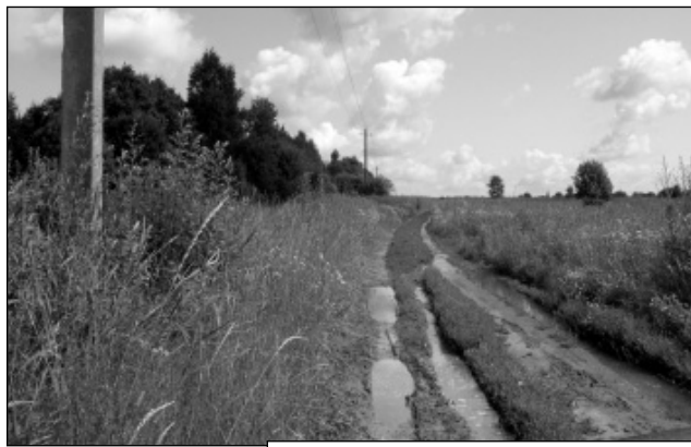
Дорога Леоново-Доманово ДО начала дорожно-восстановительных работ и ПОСЛЕ.