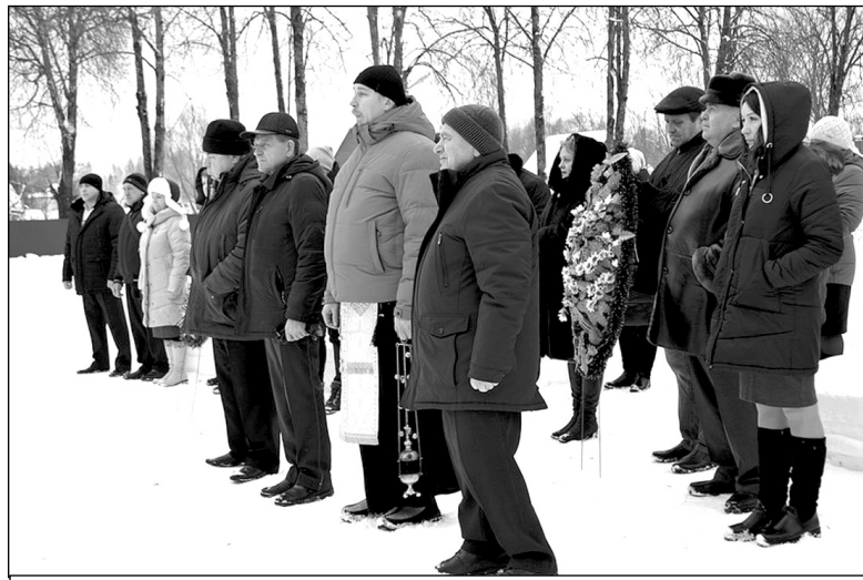
Участники митинга, посвященного 80-летию со дня освобождения с. Износки от немецко-фашистских захватчиков.

В заключение митинга настоятель храма в честь Святителя Ни-