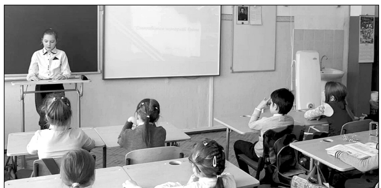
Учащиеся младших классов в память о знаменательной дате прочли стихи о войне.

Ежегодно в торжественный для износковцев День освобождения села от немецко-фашистских захватчиков Износковская средняя школа проводит мероприятия с