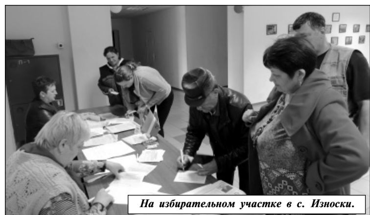
На избирательном участке в с. Износки.

вания, для проведения которого в четырех сельских поселениях района были открыты избирательные участки, на каждом из них работала участковая счетная комиссия: в с. Износки, п. Мятлево, д. Ивановское, с. Извольск.