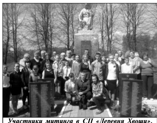
Участники митинга в СП «Деревня Хвощи».