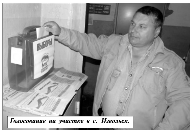
Голосование на участке в с. Извольск.

По посещаемости избирательных участков Износков-