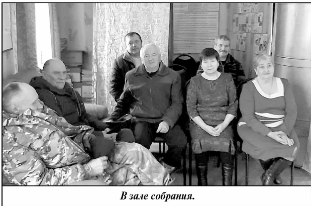
В зале собрания.

Основные поступления в бюджет муниципального образования составили налоговые доходы. Налог на имущество физических лиц выполнен на 120 процентов или 251 300 рублей при плане 210 000 рублей. Земельный налог с физических лиц выполнен на 104 процента или на 253 500 рублей при плане 243 500 рублей, земельный налог с организаций выполнен на 100 процентов и со-