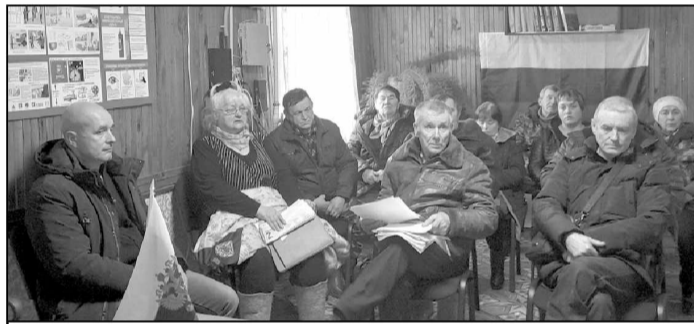
На отчет главы администрации сельского поселения пришло немало людей.