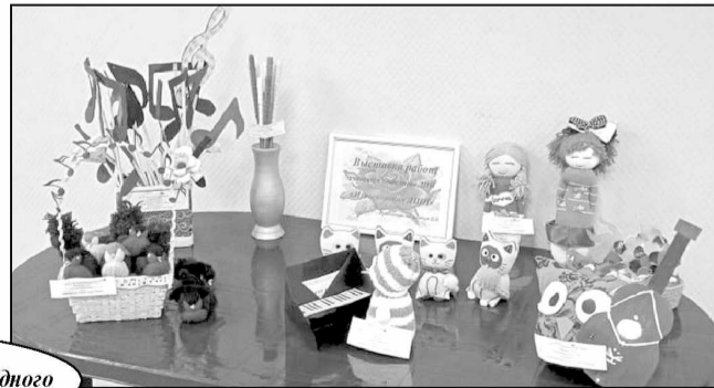
Работы учащихся отделения декоративно-прикладного искусства ДШИ.