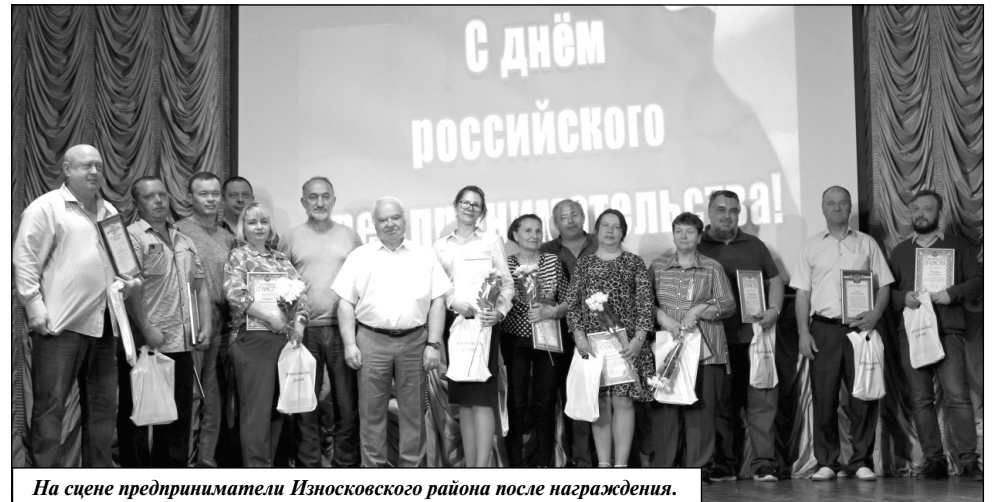
На сцене предприниматели Износковского района после награждения.

ответы на которые дали квалифицированные специалисты.