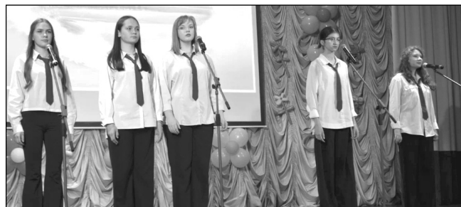
Ансамбль «Гармония» Износковской ДШИ.