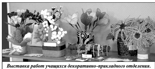
Выставка работ учащихся декоративно-прикладного отделения.

метные танцы, впечатляя своим разнообразием и мастерством исполнения.