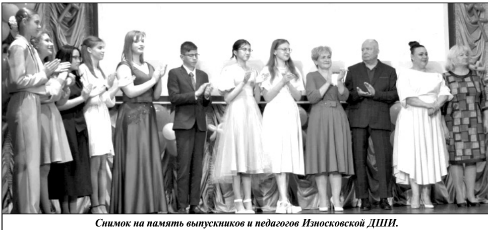
Снимок на память выпускников и педагогов Износковской ДШИ.

ков. Все, кто присутствовал на этом ярком празднике, соприкоснулись с удивительным миром музыки, окунулись в прекрасный и неповторимый мир искусства. Со сцены звучали произведения классиков и современных авторов, один за другим сменялись искро-