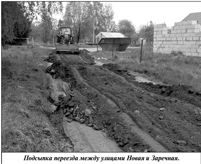
Подсыпка проезда между улицами Новая и Заречная.