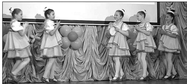
Младшая и средняя группа «Серпантин» с танцем «Светлая пасха».