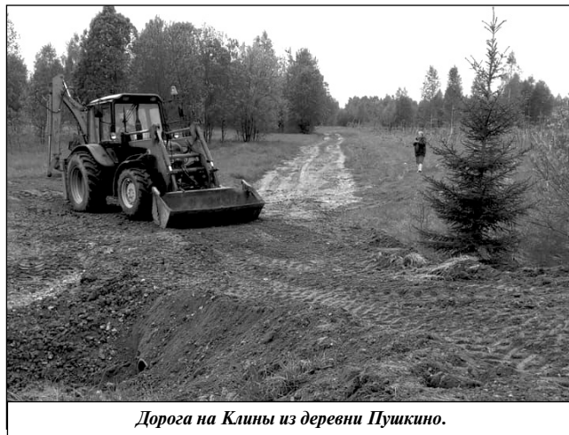
Дорога на Клины из деревни Пушкино.