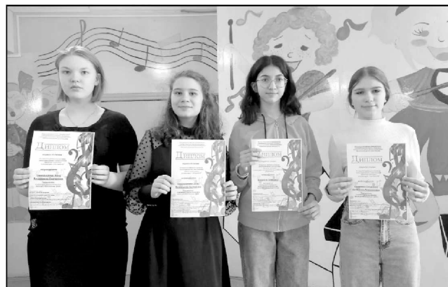
Участники конкурса «Весенняя рапсодия» в п. Ферзиково.

28 марта учащиеся Износковской ДШИ приняли участие в X открытом районном конкурсе юных музыкантов — исполнителей «Весенняя рапсодия», организованном Ферзиковской детской школой искусств. Юбилейный, десятый, конкурс был проведен на сцене Центра культурного раз-