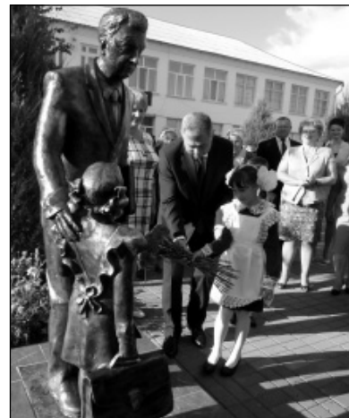
А.Д. Артамонов возлагает цветы к скульптурной композиции памяти А.Ф. Иванова.

P.S. В этот же день временно исполняющий обязанности губернатора Калужской области А.Д. Артамонов встретился с представителями старшего поколения Износковского, Медынского и Юхновского районов.