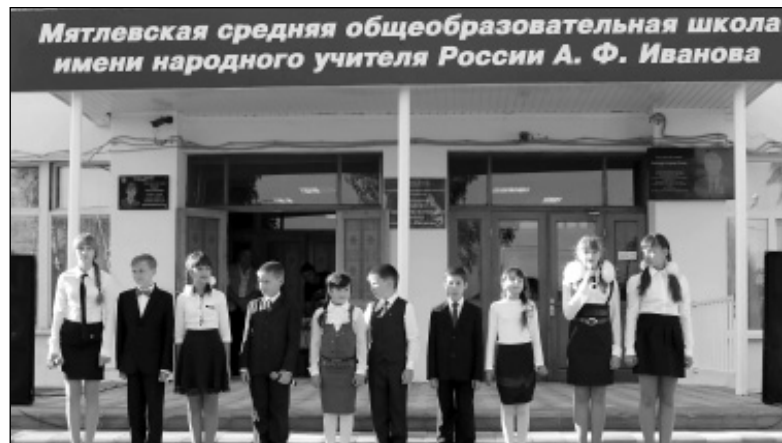
Об успехах Мятлевской средней общеобразовательной школы имени Александра Фёдоровича Иванова рассказывают учащиеся младших классов.