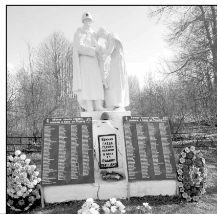
На братском захоронении в д. Зубово трудятся сотрудники Износковских РЭС.