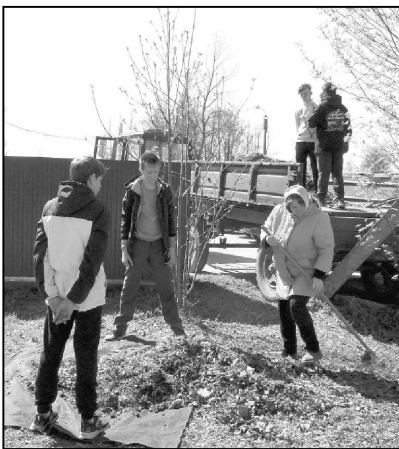
Уборка территории вокруг Износковской школы.