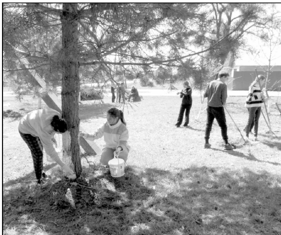
Учащиеся Износковской СОШ на субботнике в сквере Памяти.