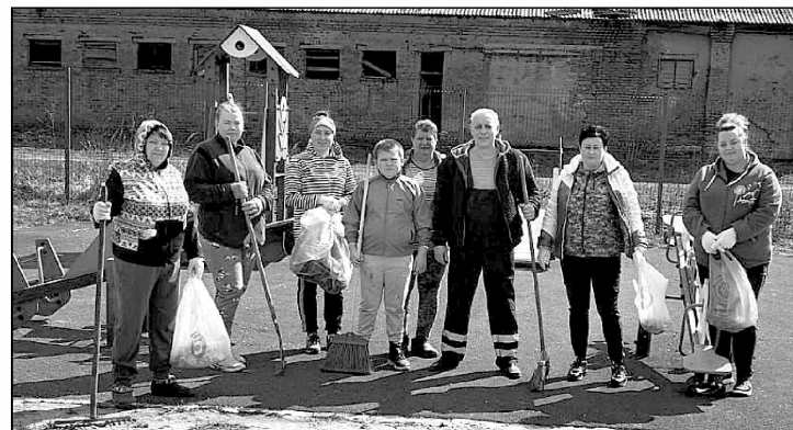
Трудовой десант на детской площадке на улице Мичурина.