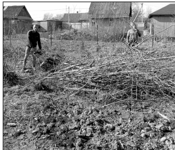
Сотрудники МУП «Калужский лес» за работой.