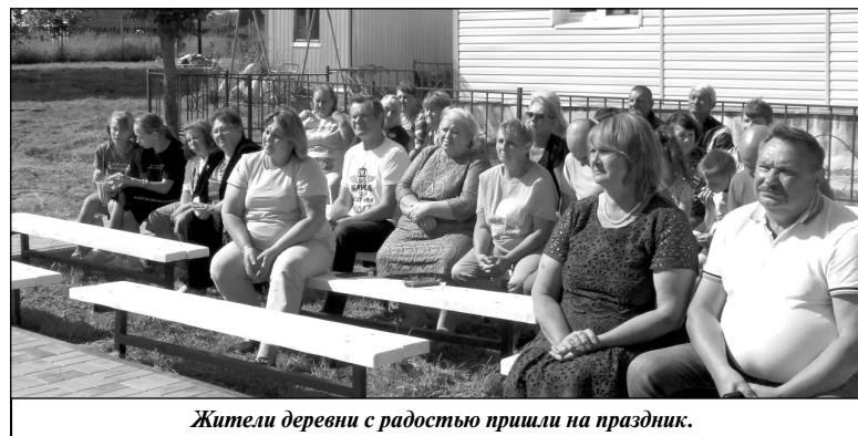
Жители деревни с радостью пришли на праздник.