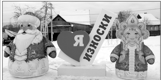
Яркие фигуры Деда Мороза и Снегурочки встречают жителей и гостей села возле стелы «Я люблю Износки».

Также спонсорская поддержка была оказана Шанско-Заводской школе, над которой экотехнопарк негласно взял шефство. Ранее с помощью предприятия был проведен ремонт школы, построена детская спортивная площадка, реконструирована дорога. А для празднования Нового года в этом году помогли закупить украшения для школы и подарки детям за участие в школьных и районных конкурсах. Кроме того, для проведения мероприятий у