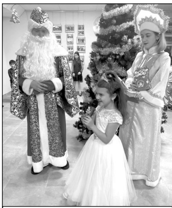
Детский новогодний утренник «Вместе встретим Новый год».

30 декабря в физкультурно-культурном центре «Олимпийский» для детей дошкольного и школьного возраста по традиции прошел новогодний театрализованный музыкальный утренник «Вместе встретим Новый Год». Интересный сюжет завораживал юных зрителей, увлекая в волшебный мир сказки. Праздник сопровождался играми, хороводами, конкурсами, и, конечно, все