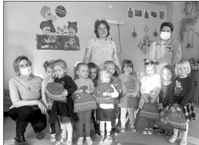
В детском саду «Солнышко».

Более того, все, кто в новогодние праздники сделал фото со сказочными персонажами, могли принять участие в новогоднем конкурсе, который предприятие, как и в прежние годы, провело для всех жителей района. Условия конкурса были очень просты: нужно было сделать фото и разместить его в социальной сети «Инстаграм», отметив экотехнопарк. По-