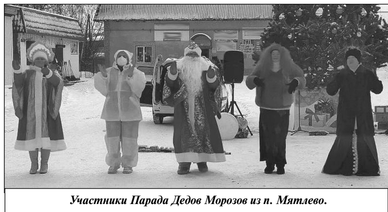
Участники Парада Дедов Морозов из п. Мятлево.

играли в веселые игры, танцевали и пели. А в завершение праздничного представления всем были вручены дипломы и подарки.