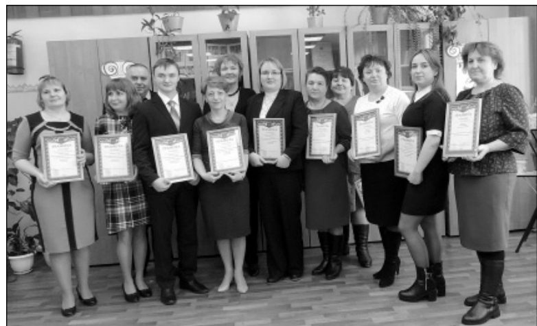
Участники районного этапа конкурса «Учитель года-2017. Я в педагогике нашел свое призвание» (фото на память).

Все конкурсанты стали участниками исторической реконструкции, подготовленной вместе с учениками пятого класса молодым