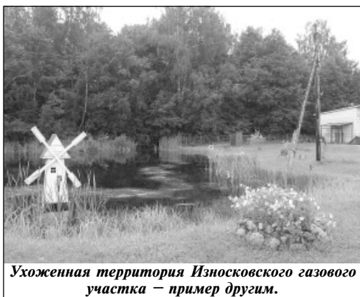
Ухоженная территория Износковского газового участка – пример другим.

Р.С. Пока готовился номер нашей газеты, некоторые граждане, руководители предприятий и организаций приступили к наведению порядка на своих территориях и возле учреждений. И хорошо, ведь это обойдется им дешевле, чем выплачивать штраф! Может, стоит всем без исключения принять во внимание этот факт?