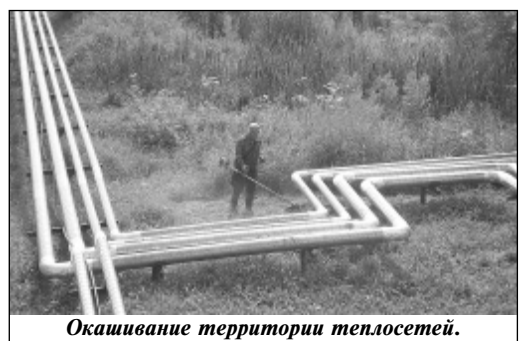
Окашивание территории теплосетей.

Работы по благоустройству ведутся в нашем районе круглый год. На дворе лето, да причем дождливое, трава растет не по дням, а по часам, потому и не смолкают косилки, да и результат работы уже налицо. Приятно видеть порядок на территории районной поликлиники и здания стационара Износковской ЦРБ, в чем немалая заслуга как сотрудников больницы, так и рабочего