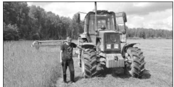
На косейке травы М. Сочнев.

На сегодняшний день в ближайших планах К.Н. Злобина подгото-