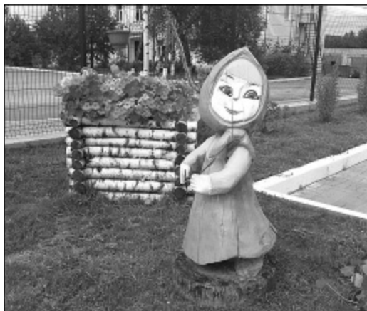
Вот такая красота и порядок возле детского сада «Солнышко».

О необходимости приведения в порядок придомовых и закрепленных территорий нередко представителям районной администрации приходится напоминать нерадивым хозяевам, гражданам, предпринимателям. Придать населенным пунктам нашего района красивый внешний облик – непростая задача и для главы администрации любого сельского поселения. Но населенный пункт только тогда приобретёт до-