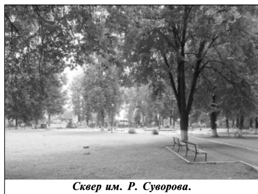
Сквер им. Р. Суворова.

Тема окаживания сейчас особенно актуальна, когда в связи с погодными условиями сложилась благоприятная среда для роста травы. Своевременное окаживание положительно влияет на санитарную обстановку, придает вид порядка, указывает на хозяйственный подход и уважение к себе и окружающим.