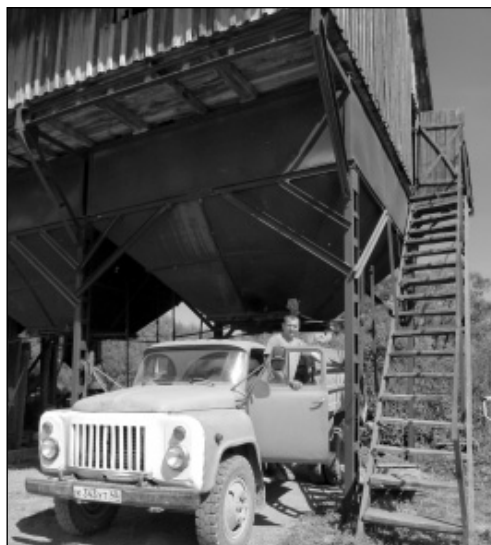
Механизатор И.А. Емельянов поставил машину под погрузку.