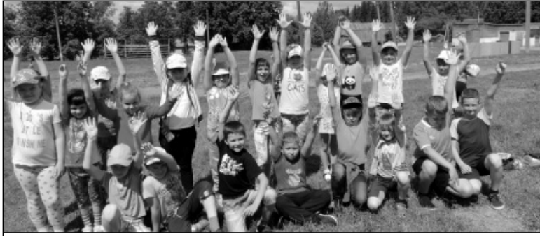
Команда младших школьников «Стрела», победитель игры «Мы и природа».

В течение полутора часов команды старших школьников «Метель», «Молния», «Возрождение» путеше-