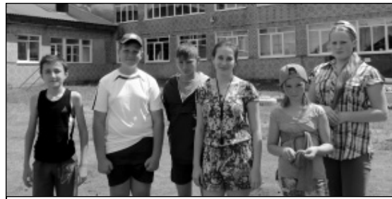
Команда «Возрождение» - победитель среди школьников старшего возраста в игре «Мы и природа».

ствовали по станциям «Продолжи пословицу», «Походная ситуация», «Экологические катастрофы», отве-