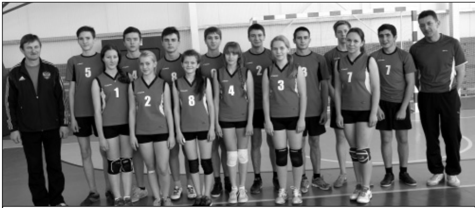
Мятлевские волейболисты - победители спартакиады школьников.

цями школьников наши мамы. Все чаще и чаще прекрасная половина появляется не только на занятиях в группе здоровья, но и на школьном стадионе, и в тренажерном зале. Действительно, хорошо, что все больше и больше людей начинают понимать,