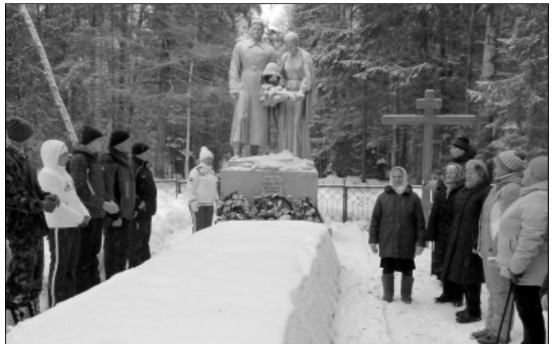
После финиша. Торжественный митинг у братского захоронения близ деревни Игумново. Двенадцать километров позади.