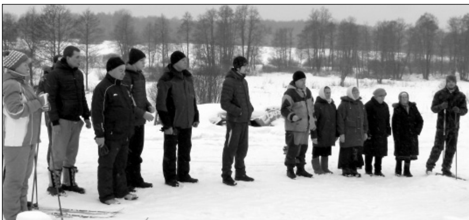
Торжественный митинг у братской могилы в урочище Клины перед двенадцатиклометровым лыжным пробегом по местам боев в деревню Игумново, посвященном памяти 24-го лыжного батальона 33-й армии, погибшем в 1942 году в урочище Клины.

После мероприятия участники пробега ждала горячая гречневая каша с мясом, которую сотрудники СОК «Истринский» приготовили здесь же. Запахло дымом от костра, вокруг которого расположились погреться участники пробега, и не хо-