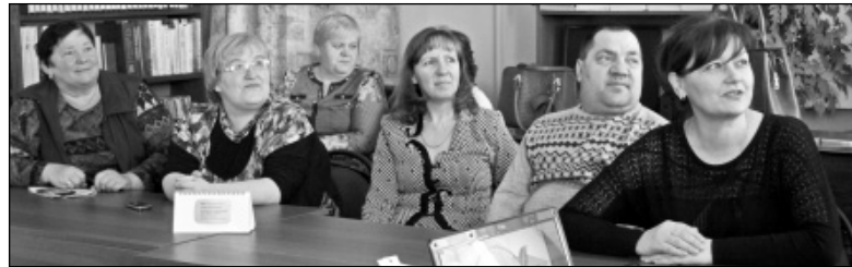
Команда депутатов сельской думы с. Износки.

онного Совета и депутатов сельской думы с. Износки. Несмотря на чрезмерную занятость, депутаты откликнулись на предложенное им приглашение.