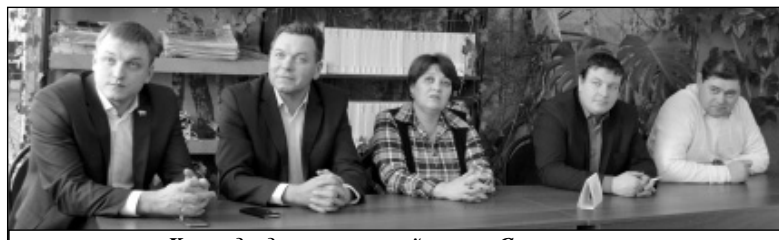
Команда депутатов районного Совета.

Открывая игру, ведущая, библиотекарь отдела обслуживания читате-