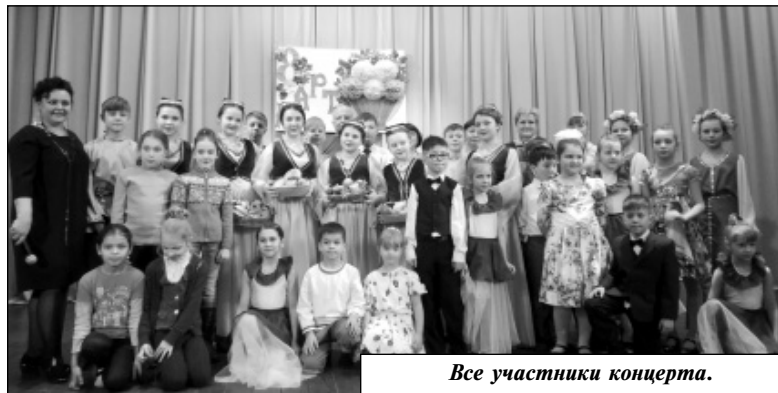
Все участники концерта.

заслужил восторженные аплодисменты. Да и весь праздничный концерт прошёл на одном дыхании, оставив зрителям заряд положительных эмоций, ведь он был подготов-