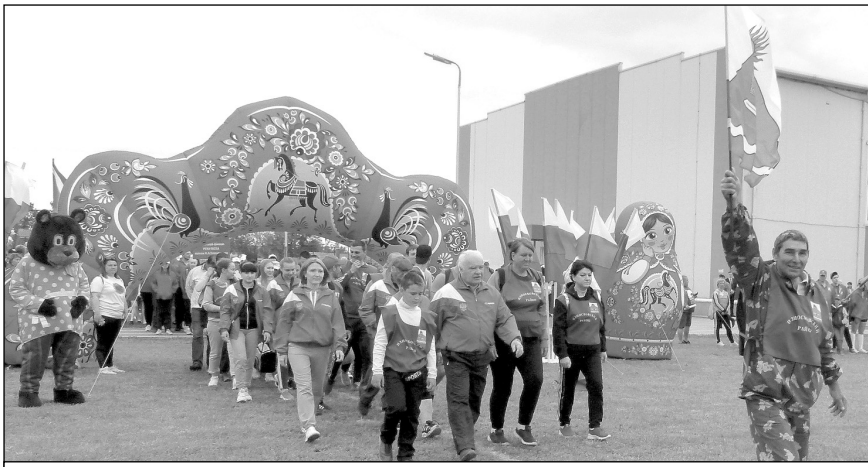
На стадионе п. Бабынино: команда Износковского района.

Атмосфера была поистине праздничной. В программе открытия спортивного мероприятия были песни, яркие танцы, выступление духового оркестра, скрипача-виртуоза и многое другое, захватывающее и незабываемое.