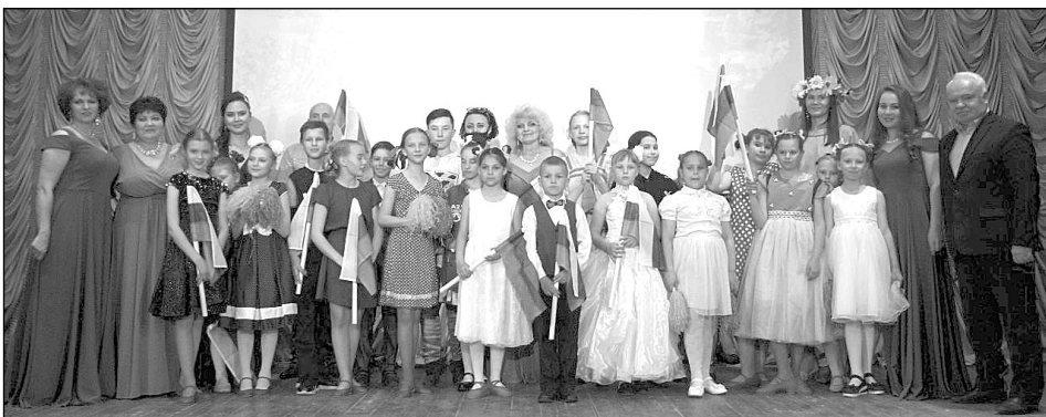
Снимок на память участников праздничного концерта с главой администрации МР «Износковский район» В.В. Леоновым (справа).