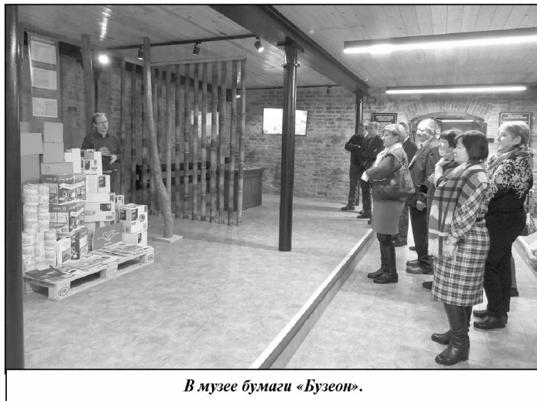
В музее бумаги «Бузеон».

В ходе экскурсии гости из нашего района узнали, что классификатор образцов бумаги, собранных в Бузеоне, содержит более 100 видов современной бумаги и что аналогом музея бумаги в Полотняном Заводе является каталонский музей бумаги в пригороде Барселоны. Музей поразил всех не только своей историей, но и экспоната-