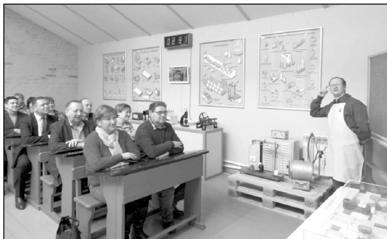
В этом павильоне каждый вспомнил о том, как когда-то в детстве писал в тетради в косую линейку, произведенной Полотняно-Заводской мануфактурой.