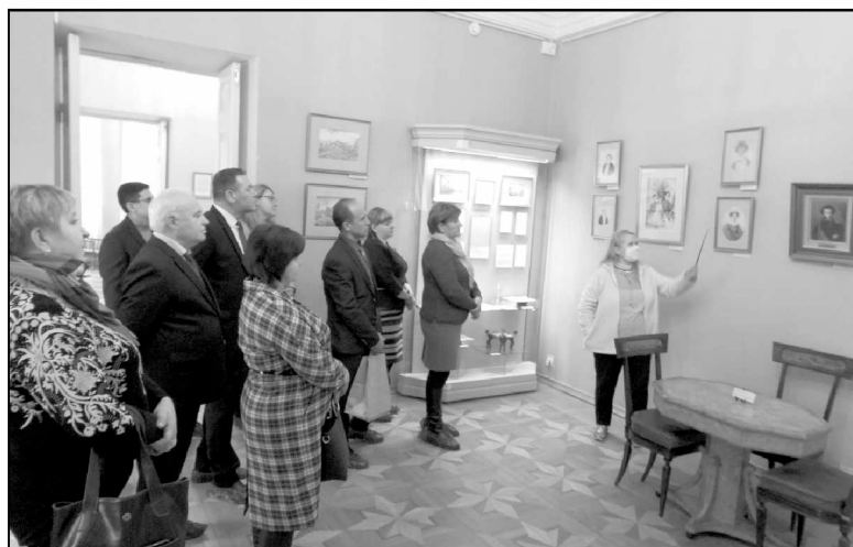
Участники экскурсии с интересом слушали рассказ о событиях Пушкинского времени, об истории усадьбы Гончаровых.

ный парк, который был жемчужиной усадьбы Гончаровых. Вход в парк до сих пор украшен двумя стройными белыми башнями, увенчанными остроконечными гранеными шатрами.