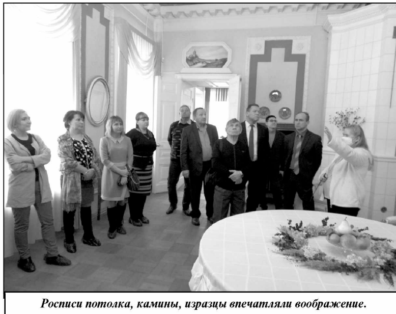
Росписи потолка, каминные изразцы впечатляли воображение.

Усадьбе Гончаровых, с одной стороны, не повезло. Во время Великой Отечественной войны она была сильно разрушена. С другой стороны, удача повернулась к ней лицом - ее отреставрировали и даже восстановили интерьеры. Причем сделали это очень бережно и с большим вниманием к деталям. Росписи потолка, каминные изразцы дошли до наших дней. Сохранился и английский пейзаж-