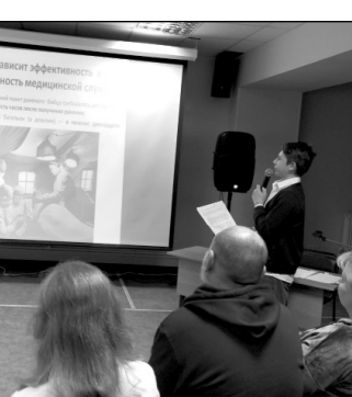
Выступление Егора Немова.

Анжелика сообщила, что у большинства женщин, принявших в свой дом раненых бойцов, было по пять — семь человек детей, время было сложное, военное, но несмотря ни на что эти