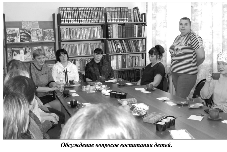
Обсуждение вопросов воспитания детей.