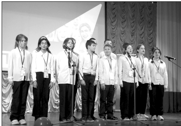
На сцене «Первые» из Мятлевской СОШ.

День пролетел на одном дыхании, ребята и их наставники проделали большую работу. Участники форума узнали, что «Движение Первых» дает им массу возможностей для реализации, прониклись духом патриотизма и получили порцию мотивации к хорошим, добрым, полезным обществу делам.