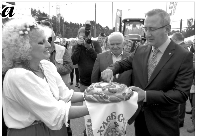
Дорогих гостей износковцы встречали хлебом и солью.

наблюдается значительный прирост объемов по зерновым, картофелю, овощам, продукции садоводства. За всем этим, по словам губернатора, стоит напряженный и каждодневный труд наших аграриев, которые с каждым годом все больше радуют жителей региона своей разнообразной и качественной продукцией.