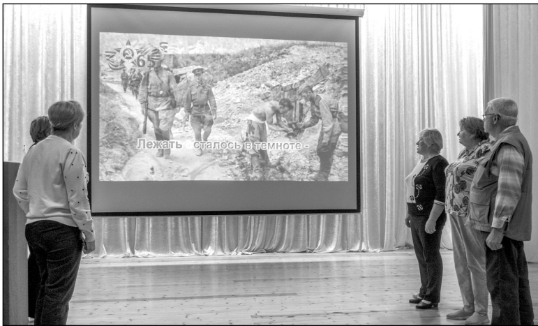
Депутаты поселкового Совета исполняют песню «На безымянной высоте».