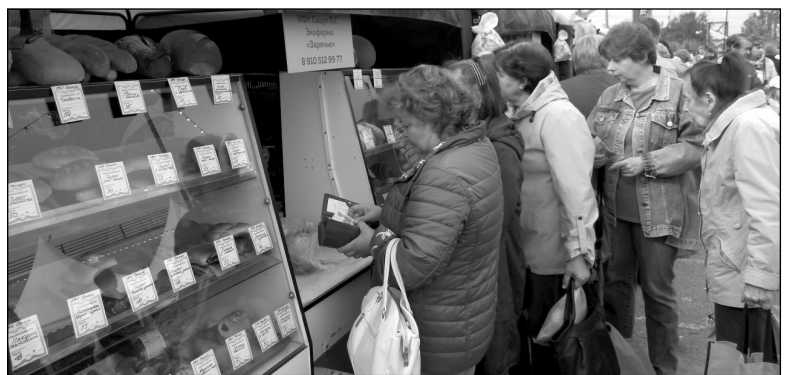
За износковскими хлебобулочными изделиями выстраивались очереди.