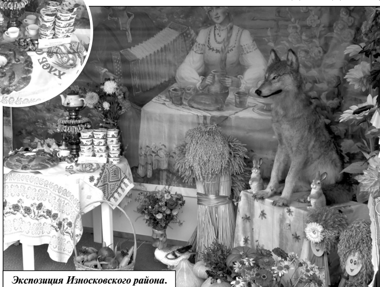
Экспозиция Износковского района.