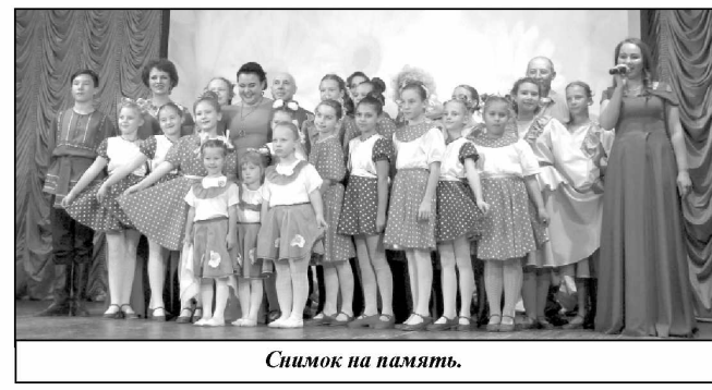
Снимок на память.

Особое внимание зрителей в этот праздничный день было приковано к выступлениям