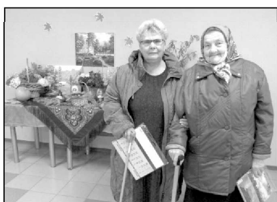
В фойе КСЦ «Олимп». Зрители: за несколько минут до начала концерта.