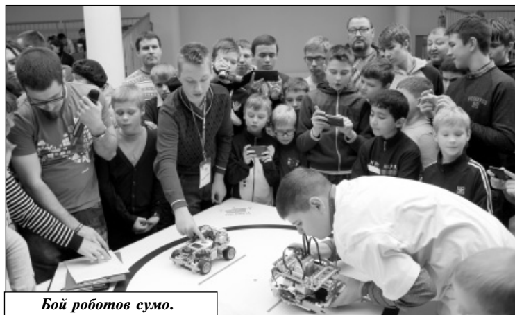
Бой роботов сумо.

Основное оборудование, используемое при обучении детей робототехнике в школах, – это LEGO-конструкторы. Существуют конструкторы LEGO различных видов, направленные на образование детей с учетом удовлетворения возрастных