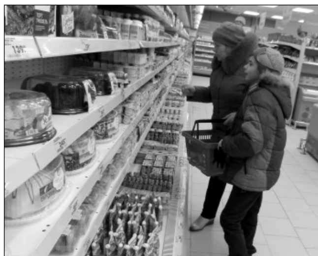
Первые покупатели мятлевской «Пятёрочки».

Радует, что наш потребительский рынок пополнился еще одним цивилизованным магазином, в котором предусмотрена гибкая система ски-