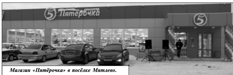
Магазин «Пятёрочка» в посёлке Мятлево.

Завершение этого года для жителей посёлка Мятлево ознаменовалось важным и значимым для них событием - в поселке был открыт новый магазин «Пятёрочка» под номером 9359. На сегодняшний день в поселке Мятлево это первый сетевой магазин, к тому же он расположен в шаговой доступности и ориентирован на людей среднего достатка, рассчитан