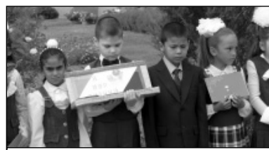
Ключ в страну знаний - в надежных руках.