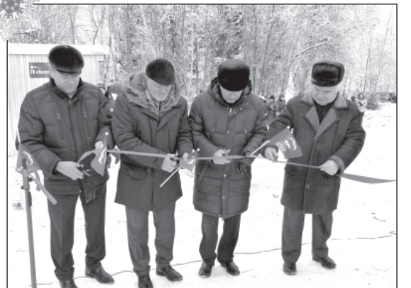
Символический момент торжественного открытия станции обезжелезивания.

Немало добрых слов было сказано в этот день местными жителями, ведь теперь вода из износковских кранов потечет по-новому. Больше