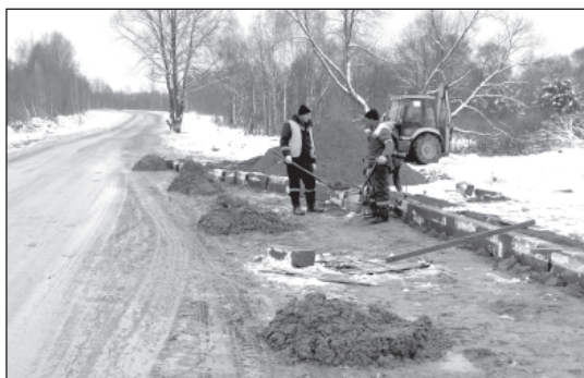
Строительство посадочной площадки общественного транспорта.

того, оно берет на себя нагрузку от транспортных средств и не позволяет плитам перемещаться. Толщина такого покрытия пятнадцать сантиметров, работы велись с июля по август.