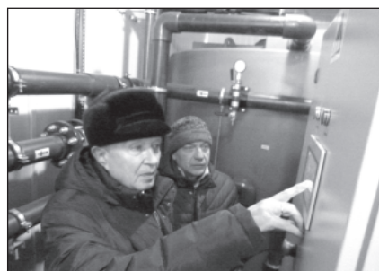
Председатель Законодательного Собрания С.В. Бабурин дал пуск станции, и чистая вода пошла в каждый дом.

никакой желтизны - воду можно будет пить прямо из-под крана.