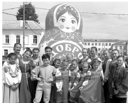
Хореографический коллектив «Серпантин» в г. Медыни.

Фестиваль дополнили мастер-классы от культурно-методического центра, выставки и лотереи, игры и конкурсы, проведенные работниками Медынской библиотеки и му-