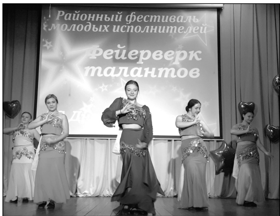
Выступает хореографический ансамбль «Серпантин».