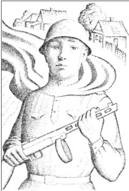
Графический портрет С. Суворова из книги Д. Оря «Немеркнущая звезда».

занью, а потом в г. Пугачево Саратовской области в артиллерийском полку. В конце зимы 1942 года Суворова