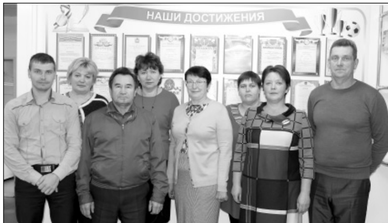
Коллектив учителей МКОУ «Основная общеобразовательная школа» д. Ивановское на фоне наград, подтверждающих школьные достижения.