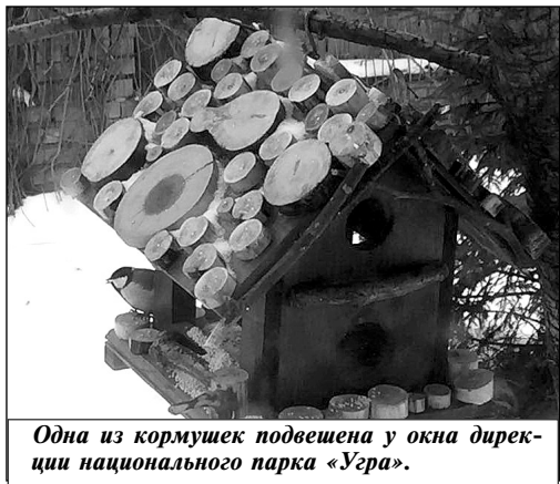
Одна из кормушек подвешена у окна дирекции национального парка «Угра».

В национальном парке «Угра» стартовала акция Союза охраны птиц России «Покормите птиц зимой!», на которую ежегодно откликается большое количество участников из самых разных уголков Калужской области. Одни изготавливают кормушки и следят за тем, чтобы в них постоянно был корм, другие выражают свое участие в выполнении творческих заданий: ри-