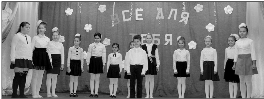
Дети, занимающиеся в кружке «Мелодия», дарят песню.