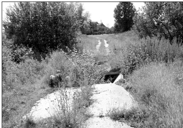
Аварийный мост через реку Восток у д. Пронькино (снимок сделан минувшим летом).

роги. Вызывает тревогу состояние моста через реку Восток у д. Пронькино, где есть постоянно проживающие жители. Приятно отметить, что частично решился вопрос по уличному освещению. В перспективе мы планируем перейти на светодиодные лампы, которые не только улучшат освещение улиц, но и сэкономят наши финансы. Отрадно отметить, что в наше поселение пришел газ, проводятся работы по