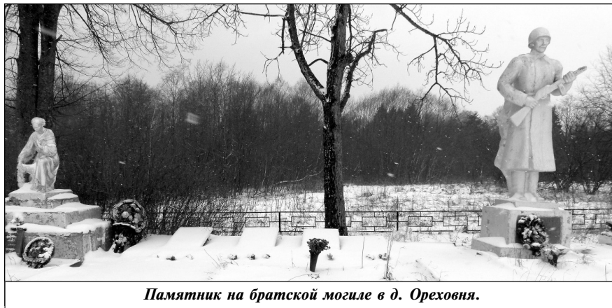
Памятник на братской могиле в д. Ореховня.