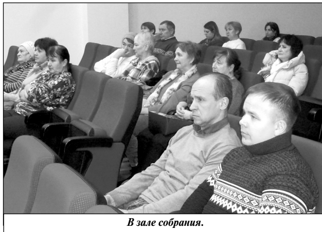
В зале собрания.

В течение 2023 года в Мятлевском ФКЦ «Олимпийский» прошли такие значимые мероприятия, как фестиваль военно-патриотической песни «Живи и помни», в котором приняли участие художественные коллективы из многих районов нашей области; некоммерческие кинопоказы полнометражных фильмов регионального проекта «Сельский кинопоказ»; торжественное заседание, посвященное 105-летию