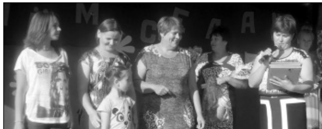
Победители в номинации «Лучшее подворье».

Служба в рядах Вооруженных сил всегда была почетна