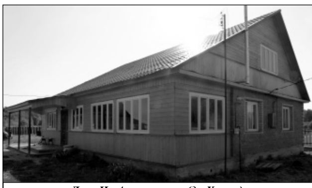
Дом И. Артамонова (д. Хвоци). Строительство окончено.

Необходимо отметить, что для получения социальной выплаты семья должна быть признана нуждающейся в улучшении жи-