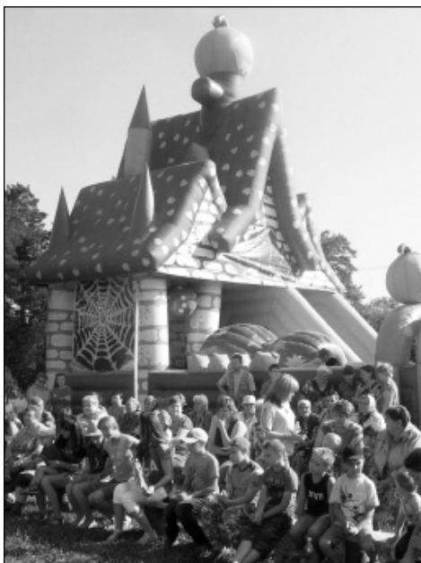
Зрителей было немало. Площадь была окружена неряельно большими красочными батутами, словно дворцами. Казалось, что это сказка...

на селе. Имена солдат, ребят, несущих службу в рядах Российской армии, всегда производят с гордостью. Вот и в этот праздничный день были названы имена ребят, служивших в Вооруженных силах страны, - это Владимир Во-