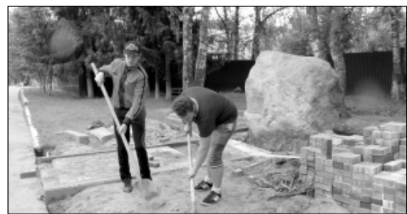
Ведутся работы на пришкольной территории Износковской СОШ.

Выезжая в каждую школу нашего района, мы обязательно беседовали с детьми. Для нас было важно узнать, нравится ли им предоставленная работа, её условия и не тяжёл ли для них труд. Везде, во всех школах, ответ ребят был одинаков, они в один голос высказывались о том, что условия и виды предоставляемых работ их полностью устраивают, и как это здорово, что есть возможность заработка в летнее время. На эти цели 100 тысяч рублей было выделено из местного бюджета и 40 тысяч рублей из областного бюджета. Хотя не большое, но все-таки подспорье для начинающего работать несовершеннолетнего гражданина. Летняя работа для подростков - это даже не столько источник финансов, сколько способ самоутверждения. Подростки стремятся к самостоятельности, которую родители не всегда могут им предоставить. А работа, пусть