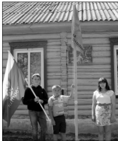
Торжественный момент поднятия флага.

Примечательно, что смена летнего оздоровительного лагеря совпала