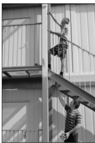
Покраска - дело кропотливое. Ивановская СОШ.

Так, в Износковской СОШ дети выполняли работу по благоустройству школьной территории, занимались уборкой помещений школы, работали на пришкольном участке. Большой объём работы был выполнен учащимися агрокласса, созданного при Износковской школе. Благодаря многолетнему сотрудничеству этой школы с Калужским