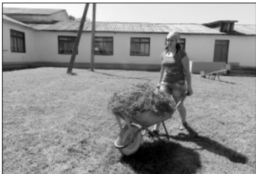
Работы ведутся в Шанско-Заводской СОШ.

но с корреспондентом районной газеты «Рассвет» посетили организации, где, согласно трехсторонним договорам с участием центра занятости, администрации МР «Износковский район» и работодателей,