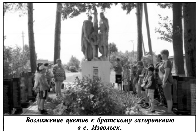
Возложение цветов к братскому захоронению в с. Извольск.

Двадцать один день лагерной смены пролетел словно один день. Ровными рядами выстроились отдохнувшие ребята на торжественной линейке, посвященной закрытию лагерной смены, на их лицах были улыбки, и в то же время в глазах была заметна грусть. Смена закончена, но ещё долго воспитатели и воспитанники будут вспоминать дни, проведенные в лагере, и тех, кто