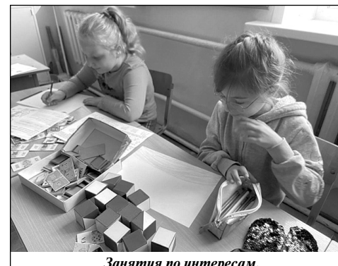
Занятия по интересам.

Запомнились ребятам разнообразные викторины и познавательные игры, которые развивали интеллектуальные способности и интерес к полезным ископаемым, животным и природе нашего края. Викторина «Эколог», проведенная вожатыми, помогла детям вспомнить правила поведения на природе. Потом дети нарисовали рисунки на экологическую тему.