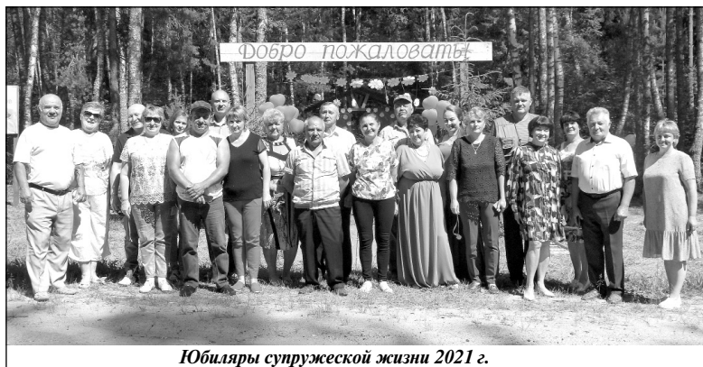
Юбиляры супружеской жизни 2021 г.

Кроме того, как и много лет назад, супруги расписались в свидетельствах о торжественной регистрации брака, в которых говорилось, что 8 июля 2021 года