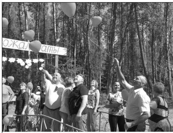
Шары в небо, как символ вечной любви...