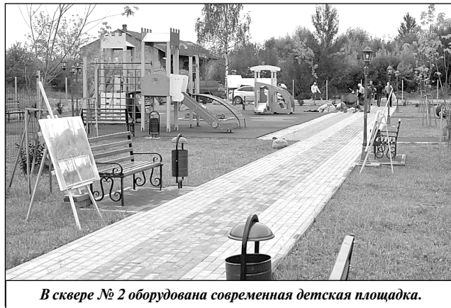
В сквере № 2 оборудована современная детская площадка.

в нужном количестве. Из-за низкого давления на выходе вода не поступает на второй этаж многоквартирных домов, ФКЦ «Олимпийский», по этой же причине крайне затруднительно заправлять пожарные машины из гидрантов. В настоящее время администрацией поселения,