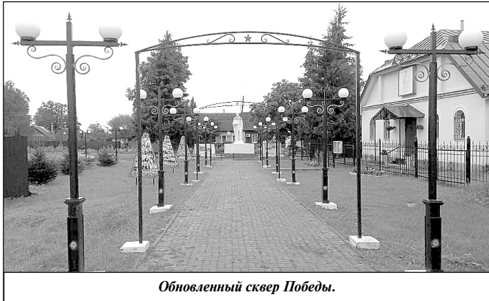
Обновленный сквер Победы.

К сожалению, невозможно в одной статье охватить все изменения, произошедшие за последние годы в поселке Мятлево. Это и новые предприятия, открывшиеся на территории поселения – «Химинвест», «Техноплюс», «ТВЕМА», «АКСИОН-РУС», «Авангард». «Уровень» и другие; открытие сетевых магазинов «Пятерочка» и «Магнит», современного пассажирского модуля на территории стан-