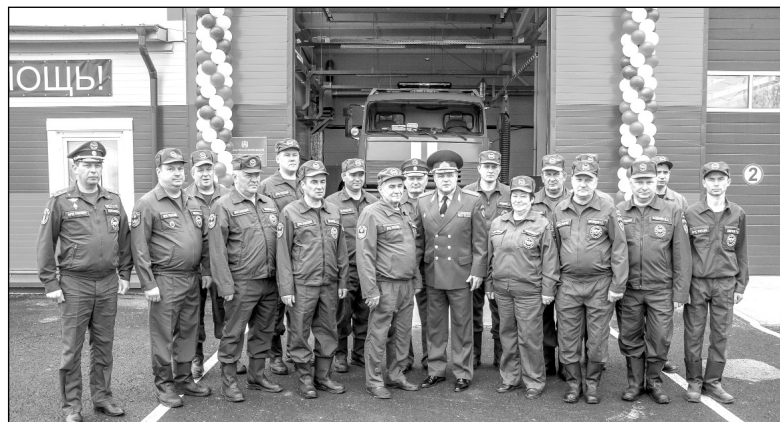
В день торжественного открытия нового депо для Мятлевской пожарной части № 36.

На торжественном открытии ФКЦ «Олимпийский», которое состоялось 30 декабря прошлого года, присутствовали губернатор Калужской области В.В. Шашин, министр сельского хозяйства Калужской области Л.С. Громов, региональный министр спорта О.Э. Сердюков,