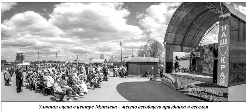
Уличная сцена в центре Мятлева - место всеобщего праздника и веселья

Подробная информация об онлайн-конкурсе размещена на сайте проекта http://rustudy.org