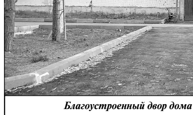
Благоустроенный двор дома № 1 на улице Первомайской.

Сегодня, по прошествии более полугода со дня открытия ФКЦ «Олимпийский», можно с уверен-