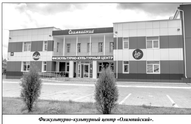
Физкультурно-культурный центр «Олимпийский».

В сентябре этого года наряду с выборами кандидатов в Государ-