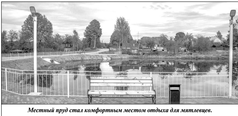
Местный пруд стал комфортным местом отдыха для мятлевцев.

ции «Мятлевская»; улучшение качества уличного освещения, которое стало возможным благодаря целевой программе регионального министерства финансов, основанной на местных инициативах. Установлены 24 светильника в поселке Мятлево, уличное освещение появилось в деревнях Айдарово и Коново. Кроме этого, 20 светодиодных светильников были бесплатно выделены депутатом Законодательного Собрания М.Г. Дмитриковым. Благодаря акции областного депутата под названием «Безопасно, когда светло», появился свет в ночное время на улице Лесная, увеличилось количество работающих фонарей на улицах Дальняя, Горького. И это не единственная помощь Михаила Григорьевича, который всегда отзывается на обращения мятлевцев, помогает по мере своих возможностей.