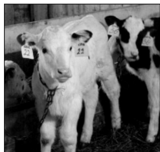
Породистый и весьма перспективный!

Подводя итог практической завершившейся зимовки, руководитель СХПК «Холмы» П.И. Маркелов отметил, что для того, чтобы она была успешной, в 2015 году в хозяйстве был заготовлен большой объем кормов - больше, чем в предыдущем 2014 году. На зиму в сельхозпредприятии было заложено 3000 тонн сочных кормов (сенаж, силос) очень хорошего качества. Кроме того, было заготовлено 500 тонн сена, 100 тонн соломы, в минувшем году в сельхозпредприятии был очень хороший урожай зерновых, благодаря чему зернофуража было заготовлено около 400 тонн. Естественно, что хорошая кормо-