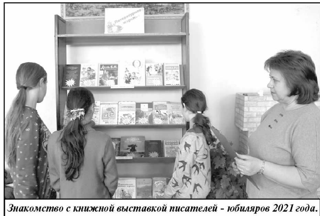
Знакомство с книжной выставкой писателей – юбиляров 2021 года.