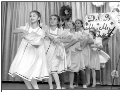
Танцевальный ансамбль «Ладушки» Мятлевского ДК.