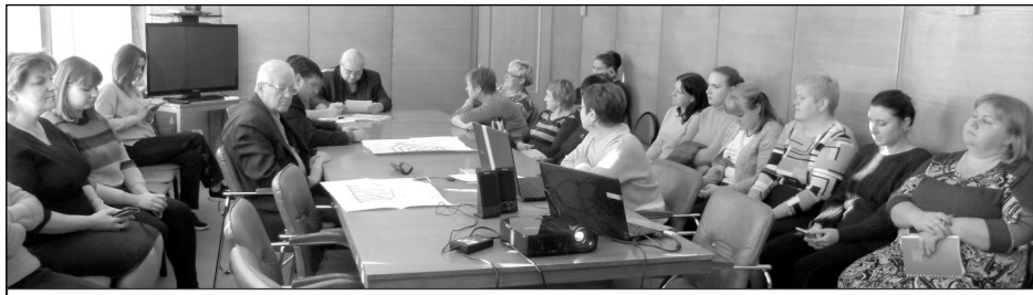
Заседание публичных слушаний.

Может, кому-то это сегодня и непонятно, но вопросы инженерной подготовки будут детально прораба-