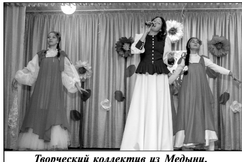
Творческий коллектив из Медыни.

Отметили главы и многодетных матерей, которых наградили памятными подарками. Ну и, конечно, в этот прекрасный ноябрьский праздник выразили благодарность гостям и подарили им хо-