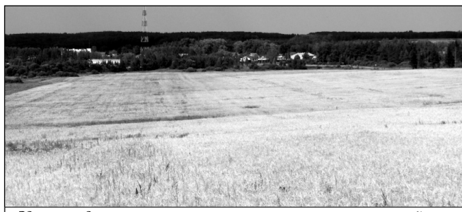
Здесь предполагается строительство нового микрорайона.