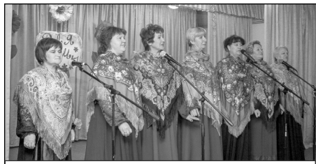
Вокальный ансамбль «Околица» СП «Деревня Барсуки».

танцевали, читали стихи. Концертная программа получилась яркой и разнообразной. С этой задачей отлично спра-