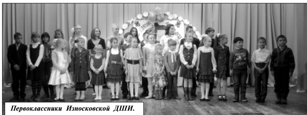
Первоклассники Износковской ДШИ.