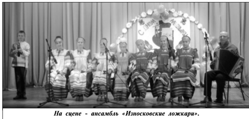
На сцене - ансамбль «Износковские ложки».