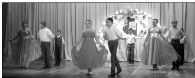
Вальс в исполнении учащихся хореографического отделения.

не случайно ансамбль Износковских ложкарей по-прежнему любим зрителями как в нашем районе, так и далеко за его пределами. Стоит также отметить, что состав ансамбля постоянно молодеет, не теряя при этом своей виртуозности и мастерства.