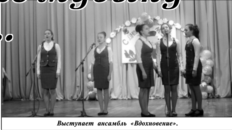
Выступает ансамбль «Вдохновение».

Первым для выступления ступил на сцену КСЦ «Олимп» ансамбль «Износковские ложки» под управлением В.В. Цоголова. В их исполнении прозвучали русский народный танец «Яблочко» и песня