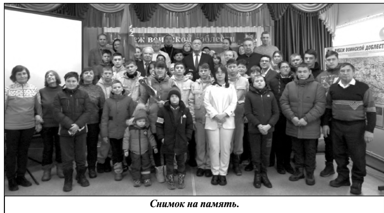
Снимок на память.