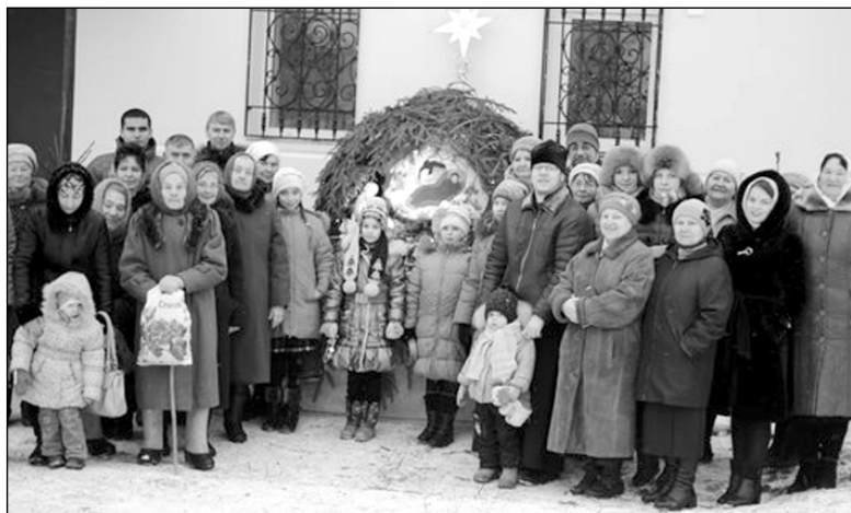
цы помолились чудотворной Калужской иконе Божией Матери. Приехав в монастырь, они поклонились раке преподобного Тихона Калужского и побывали на святом источнике.

По пути в Свято-Тихонову Пустынь Мятлевский приход посетил Георгиевский Собор, где богомоль-