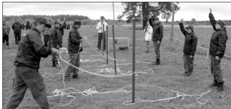
Один из самых сложных видов соревнований - вязание пожарных узлов и петель. На старте команда Мятлевской СОШ.