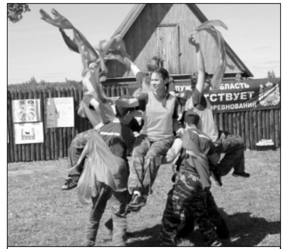
Выступление агитбригады Мятлевской школы.

Главное управление МЧС России по Калужской области поздравило победителей с заслуженными награ-