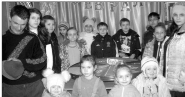
Читатели Кировской сельской библиотеки на «Поле чудес».

делается для достижения главной цели: разбудить интерес к систематическому чтению, к чтению хорошей литературы, к самопознанию.