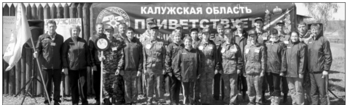
Дружная команда Мятлевской школы - серебряный призер областных соревнований.