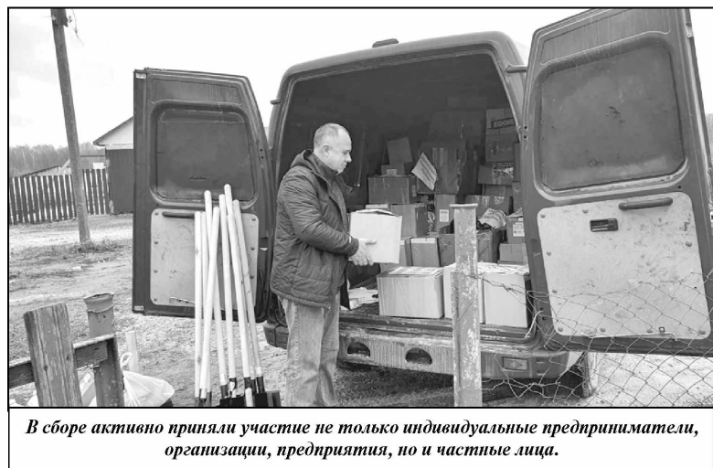
В сборе активно приняли участие не только индивидуальные предприниматели, организации, предприятия, но и частные лица.

Напомним, что в Износковском районе продолжает действовать пункт для приема гуманитарной помощи, куда могут обратиться все желающие: