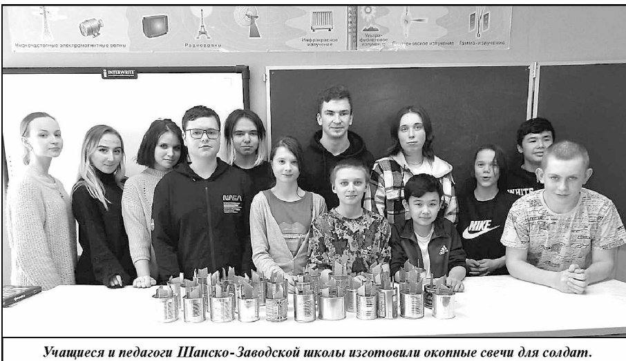
Учащиеся и педагоги Шанско-Заводской школы изготовили оконные свечи для солдат.

Учащиеся и педагоги Шанско-Заводской школы изготовили оконные свечи для солдат. Старшекласс-