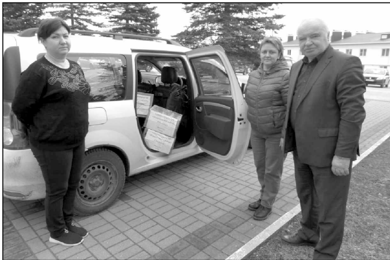
Администрация МР «Износковский район» отправила очередную партию гуманитарной помощи.

предприниматели, организации, предприятия, но и частные лица. Общими усилиями было собрано все необходимое для наших защитников, то что они писали в своих списках: и вещи, и продукты, и строительный инструмент,