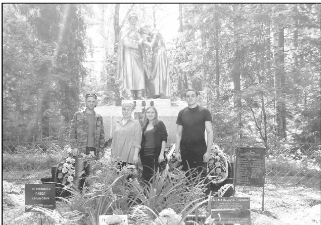
Актив молодежного совета Износковского района у братского захоронения в д. Туровка.

Готовясь к празднованию 75-летия Победы, актив моло-