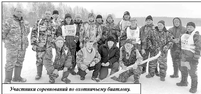
Участники соревнований по охотничьему биатлону.