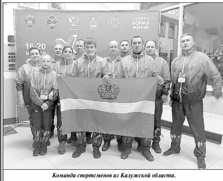
Команда спортсменов из Калужской области.