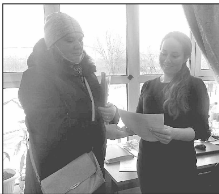
Члены специальной рабочей группы, созданной в районе для отбора общественных территорий, подлежащих благоустройству раздают листовки с информацией о предстоящем голосовании.