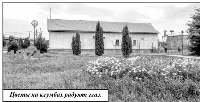
Цветы на клумбах радуют глаз.