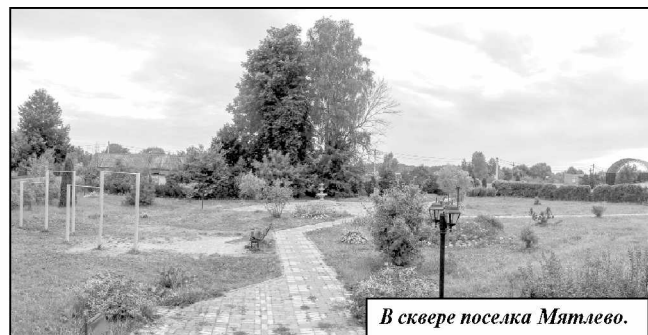
В сквере поселка Мятлево.