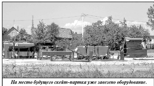
На место будущего скейт-парка уже завезено оборудование.

слову, весной текущего года в данный пруд были запущены мальки толстолобика и белого амура. А еще мятлевский пруд облюбовало семейство диких уток. И если в прошлом году здесь жила только пара уток, то в этом году по водной глади плавают уже большое утиное семейство. Местные жители