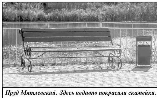
Пруд Мятлевский. Здесь недавно покрасили скамейки.

местная администрация, деятельности коммунально-бытового предприятия поселка Мятлево, индивидуальным предпринимателям, в чистоте и порядке содержатся скверы поселка Мятлево, братские захоронения, цветочные клумбы, сена на центральной площади, родник и пруд на улице Первомайская. К