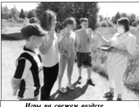
Игры на свежем воздухе.

Не случайно один из законов орлят гласит: «Орленок стремится стать достойным гражданином и защитником своего Отечества, изучает его историю, а также историю своей малой родины».