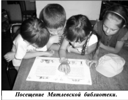
Посещение Мятлевской библиотеки.

Профилактические беседы и минутки здоровья, которые проводятся в оздоровительном лагере, знакомят ребят с правилами здорового образа жизни и умением сохранять свое здоровье.