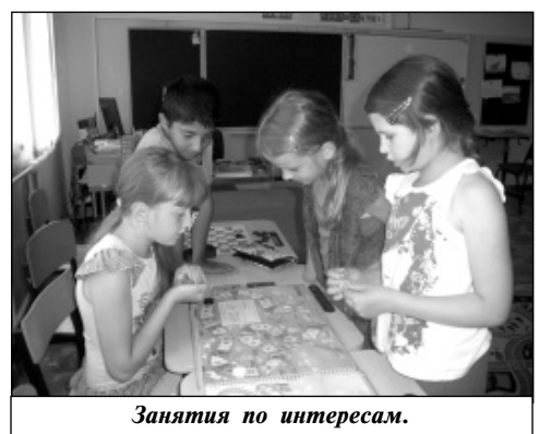
Занятия по интересам.

Воспитатели в лагере проводят с ребятами беседы, викторины по правилам безопасного поведения в обществе и на дороге, познавательные игры, конкурсы, загадывают загадки, играют в литературное лото и