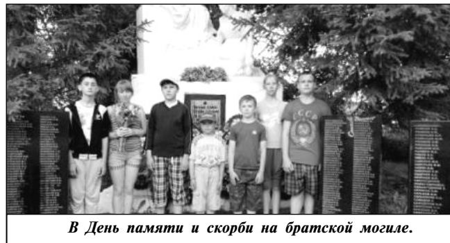
В День памяти и скорби на братской могиле.

Юбилейный год 70-летия Великой Победы подтолкнул организаторов лагеря к идее создания программы летнего лагеря «Дорогами славы России», которая является продолжением общешкольной патриотической программы «Дорогами Победы». Ведь для нынешнего молодого поколения Великая Отечественная война - далёкая история.