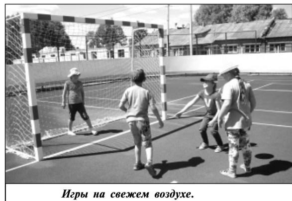
Игры на свежем воздухе.

Лагерь начал работу 1 июня, он превратил школу в маленькую страну со своими заботами, проблемами и радостями. Для ребят были оборудованы специальные помещения: «Игровая комната» и «Комната отдыха» (комната релаксации), ЦУП (центр управления путешествиями). В них есть настольные игры, шахматы, шашки, журналы, головоломки, пазлы, игрушки и т.д. Кроме того, для отдыхающих обустроен мини-спортзал. Здесь ребята зани-