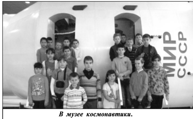
В музее космонавтики.

тивизма, ответственности, коммуникативности, толерантности. Надеемся, что каждый из ребят за время сме-