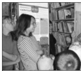
Экскурсия в сельскую библиотеку.