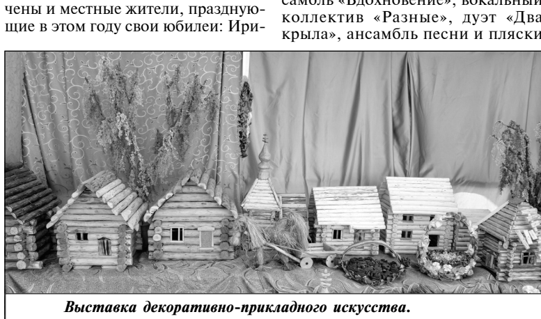
Выставка декоративно-прикладного искусства.