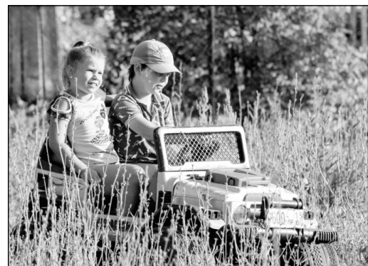
Вот такие автотранспортные средства можно было встретить в этот день на улицах села Извольск. Малыши были в восторге!

Также грамотами и подарками были отмечены и местные жители, празднующие в этом году свои юбилеи: Ири-