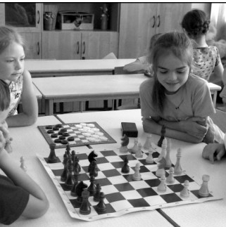
Ребята с большим удовольствием принимали участие в шахматных баталиях.

В день рождения А.С. Пушкина была проведена викторина по сказкам, поле чудес и конкурсе рисунков. Также дети